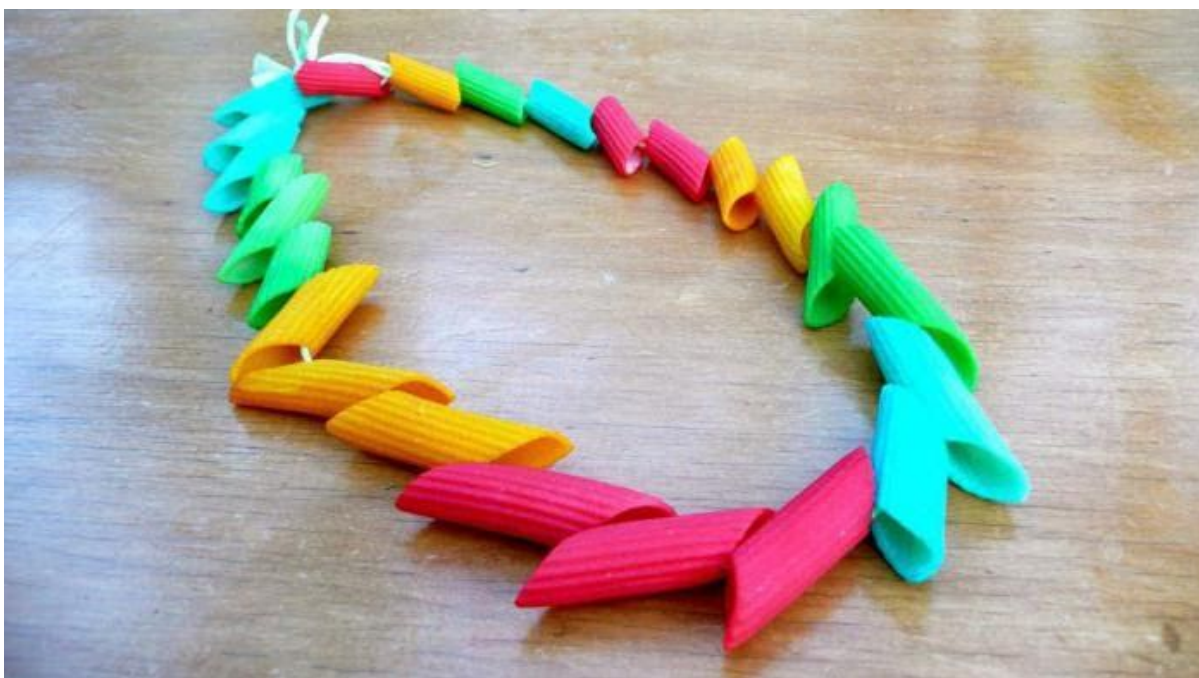
naszyjnik z makaronu